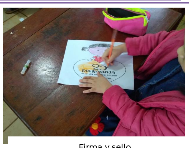
Firma y sello